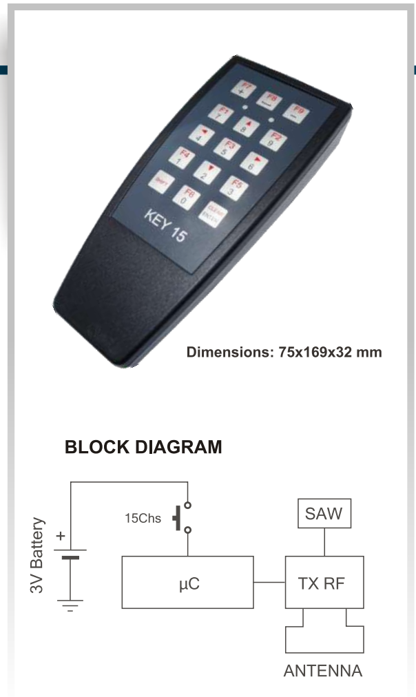
Dimensions: 75x169x32 mm

Two AA batteries will provide a long service.